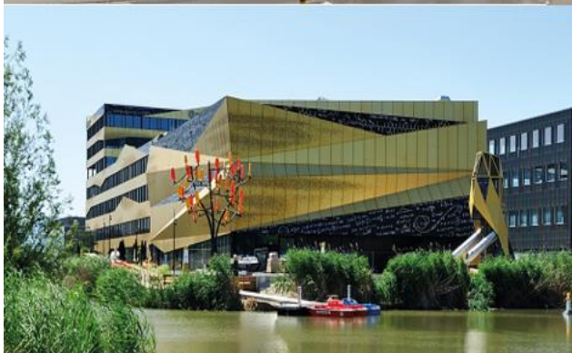
Explorit Loisirs et découvertes