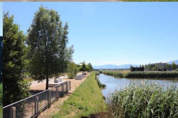
Parc scientifique et technologique