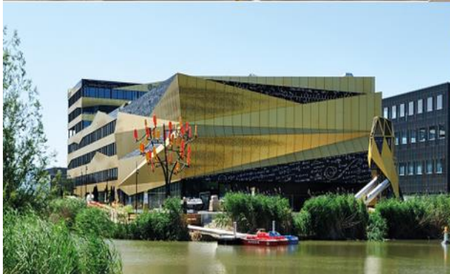
Explorit Loisirs et découvertes