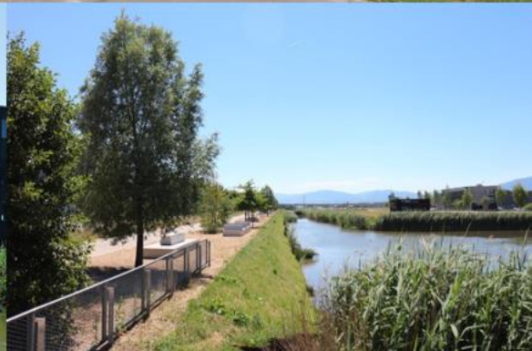
Parc scientifique et technologique