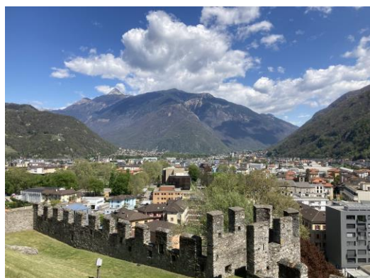
Vista di Bellinzona